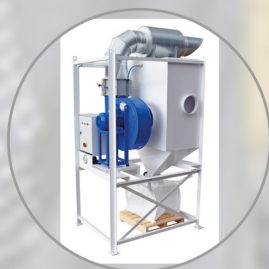
MOBILE DUST EXTRACTION UNITS