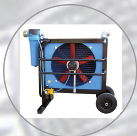
COMPRESSED AIR AFTERCOOLERS